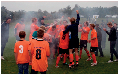
Firande i Genarp efter avancemanget till division 3

Återstoden av matchen var bara en nervös väntan på slutsignalen då det egentligen inte hände något av intresse, men då