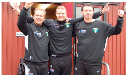
Nöjda och nyduschade Torstränare i Genarp

tiden verkade stå stilla. När slutsignalen äntligen ljöd stormades planen av glädjerusiga spelare, ledare och supportrar som firade att klubben för gången någonsin har ett representationslag i division 3 på herrsidan.