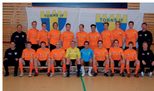
Delar av Torns IF:s herrseniortrupp efter säsongen år 2010