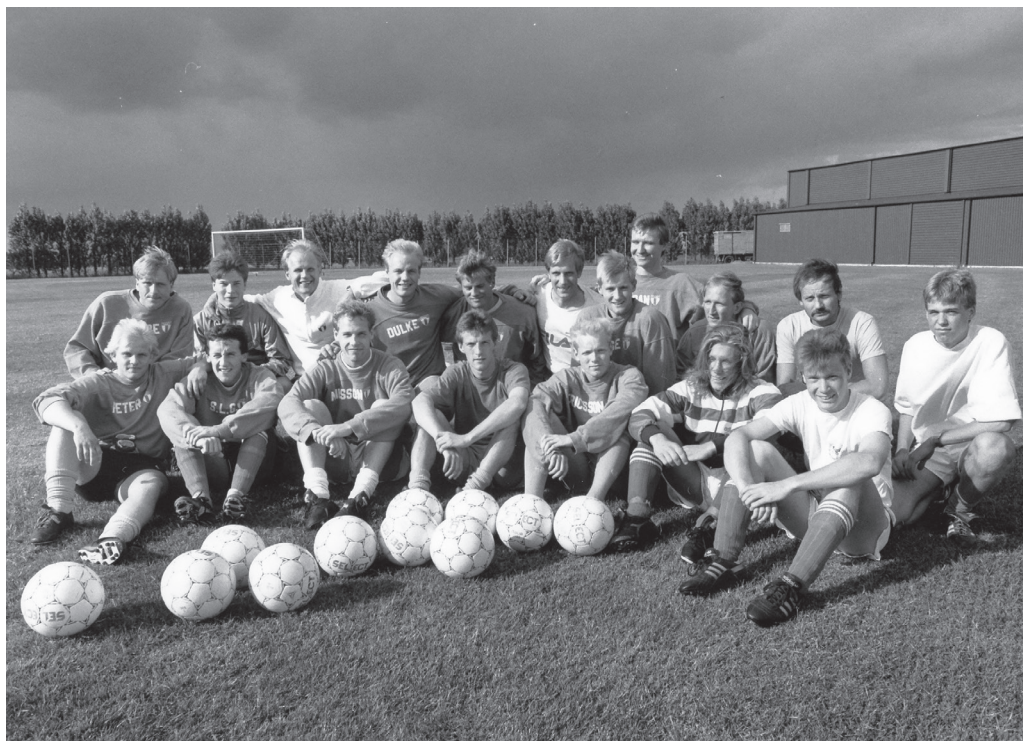
Torns IF:s herrtrupp 1990.