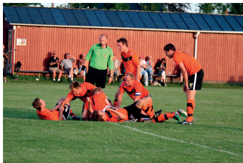
Segermålet hemma mot Höörs IS

Torn gick som tåget efter sommaruppehållet och den 10 september var det laddat för fest i Stångby. Torns IF ställdes då mot IFK Trelleborg på hemmaplan i den fjärde omgången från slutet och vid vinst så skulle man ha säkrat seriesegern genom att leda med ointagliga 11 poäng.